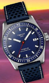
PR516 Powermatic 80 € 675 00