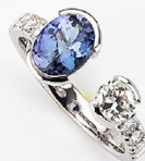
Tanzanite € 2.590 00