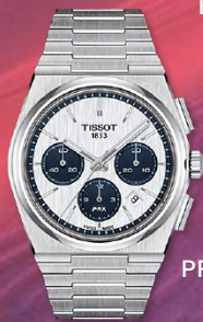
PRX Automatico Cronografo € 2.045 00