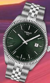
Ballade Quartz 40mm € 345 00