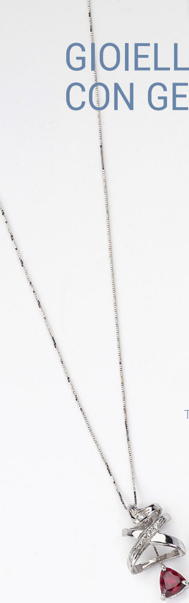
Tanzanite € 368 00