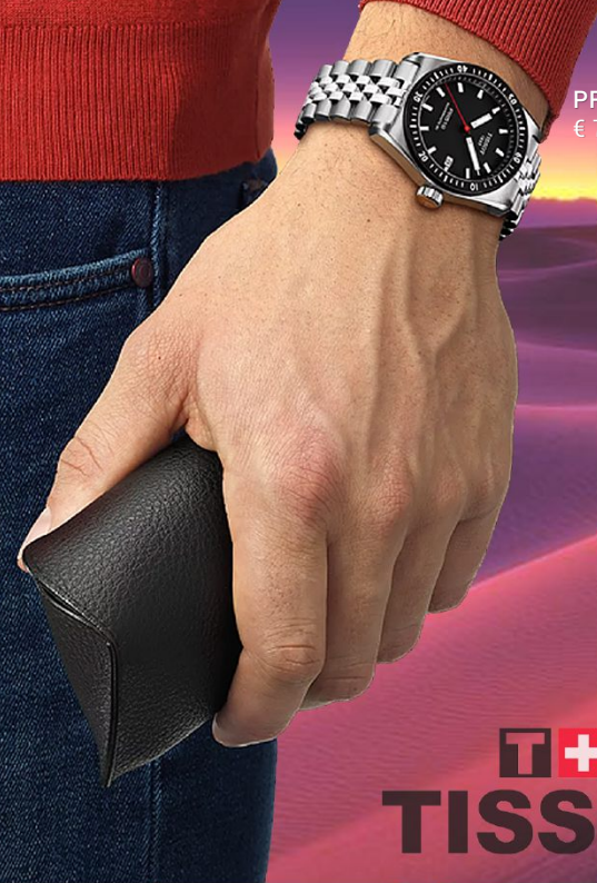
PRX Powermatic 80 € 745 00